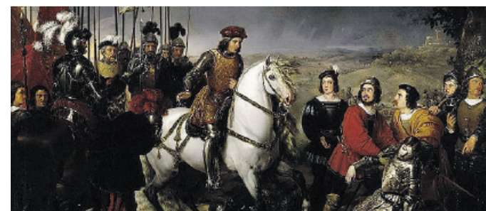
IMMAGINE SIMBOLO Consalvo vittorioso sul duca di Nemours