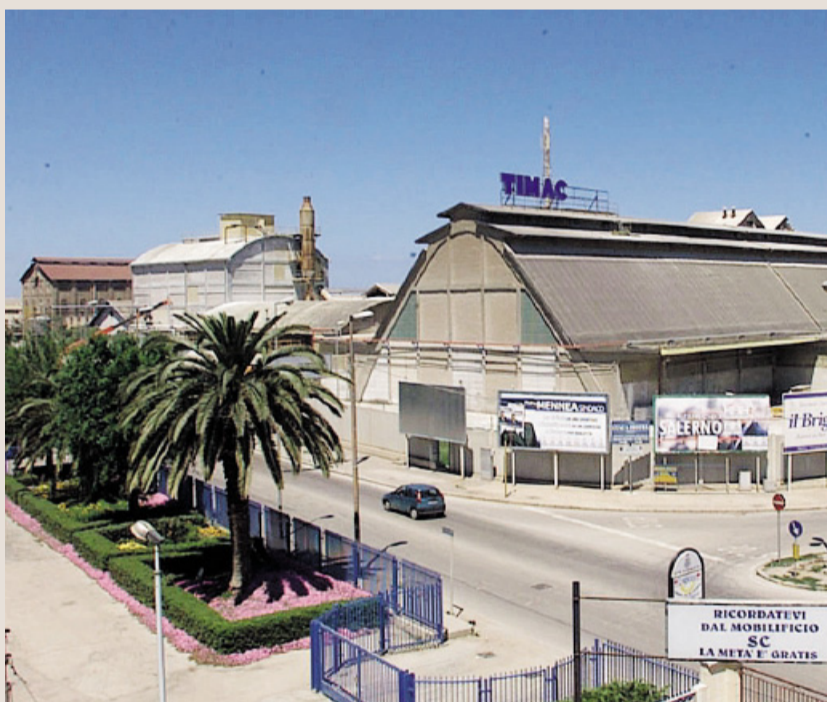
BARLETTA Lo stabilimento Timac Agro Italia