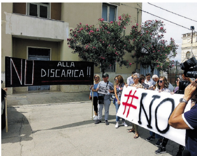
ANDRIA La protesta di Canosa e Minervino davanti alla Provincia

BUFANO, DE MARI E MATARRESE ALLE PAGINE II E III >>