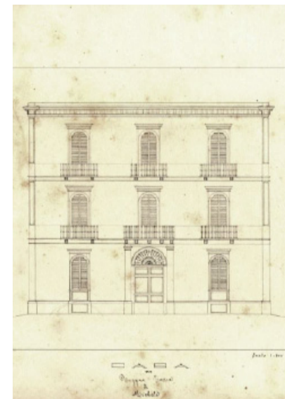
Il prospetto dell'edificio

Gli amministratori comunali si devono adoperare con amore per una città Bella e Vivibile.